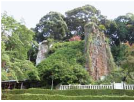
雌雄岩と呼ばれる二つの岩と、天然記念物のオガタマの老樹がある