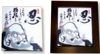
【作品例1】色紙のみ 2,000円 (郵送料等含む)