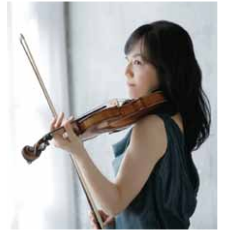
※新型コロナウイルス感染の状況により、日程変更、又は中止となる場合がございます。