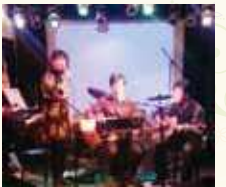
『MusicBar ABBYROAD』和歌山市あろち23番地 ユウシンビル1F 073-427-2202

ギター演奏ができる友達はマスターのリードもあってセッションを始めた。私はスポットライトを浴びて演奏する友達の楽しそうな姿を見て、ここに来て良かったとひと安心。常連客との交流も楽しく、音楽の好み異なる人々が集まるから新しい音楽の出会いも期待できる。 マスターのお人柄もあり、時間を忘れて自然体で過ごす事ができた。音楽を共通言語として人と繋がるのが心地良い。