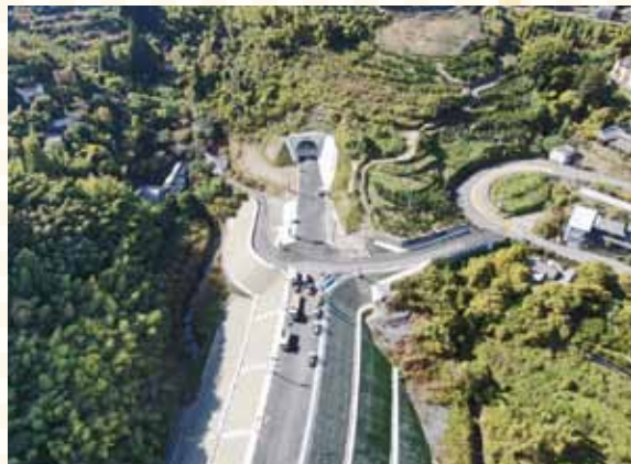
広々とした2車線で整備されたバイパス。安全でスムーズな走行が期待される。

海南省阪井の市立巽中学校で「開通を祝う会」が関係者により開催されます。なお、残り200mの区間については、引き続き改良工事が行われる予定です。 主催／和歌山県、海南省、有田川町、和歌山県道路協会