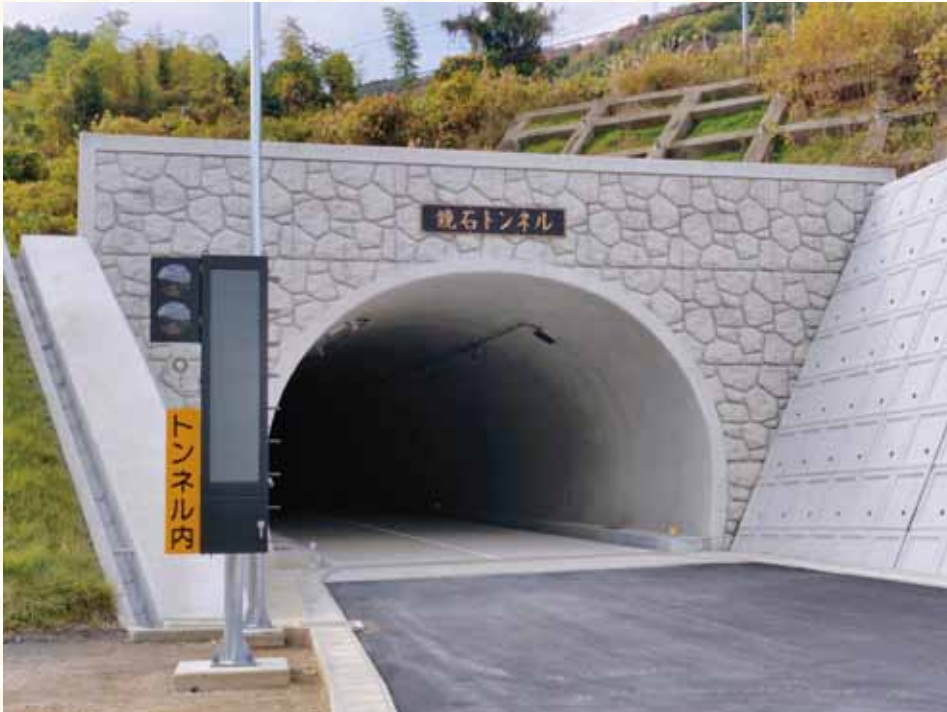
いよいよ開通を迎える鏡石トンネル(海南省側坑口)。地域の新たな大動脈となる。

新しい年の幕開け、おめでとうございます。 2026年の始まりとともに、 私たちの街をさらに元気にするビッグニュースです。 スクラムでは今年も皆様方の素晴らしい活動を全力で応援してまいります。皆様にとって、希望あふれる一年となりますように。 ツーカーネットスクラム編集部 スタッフ一同